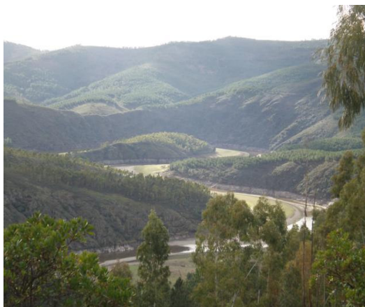
Vista espectacular de los meandros del Alagón

Sea cual fuere el lugar por el que se llegue, lo primero que sorprende al visitante es la frondosa vegetación en la que se sumerge, encontrándose con amplias panorámicas desde cualquier vuelta del camino o con escondidos rincones que aún guardan la original condición de auténticos jardines o paraísos naturales.