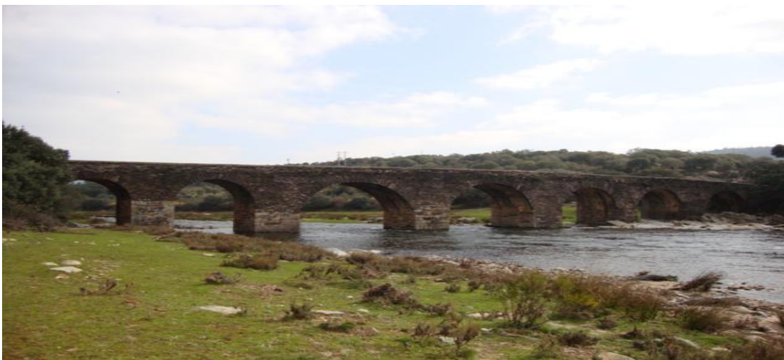
Río Alagón a su paso por Sotoserrano