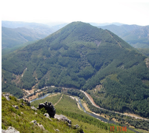
El Pardo y el río Alagón a su paso por Sotoserrano

En Sotoserrano , su intrincada geografía, de altas cumbres y encerrados valles, junto a la diferente orientación de sus laderas, la hacen participar tanto del clima atlántico como del mediterráneo, por lo que su superficie se alfombra de la más variada vegetación en la que conviven lo autóctono con lo introducido por el hombre, en una lista interminable de especies que convierten este suelo salmantino en preciado jardín o en soñado paraíso terreno.