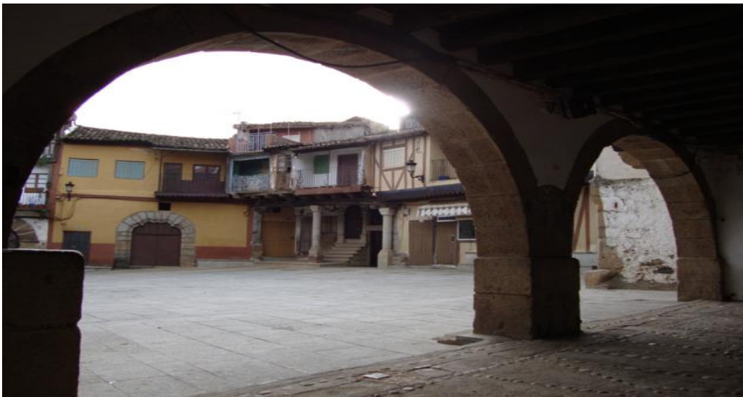
Plaza Mayor de Sotoserrano