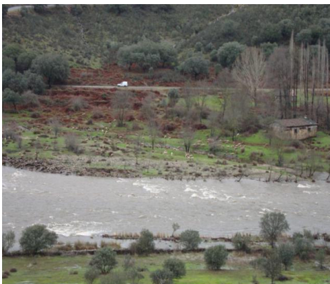
Paraje de los Molinos

En su amplio término de 5759 hectáreas ubicadas en la Sierra de Francia Baja , frontera sur de la comarca, guarda una amplia riqueza paisajística de indudable belleza, llena de matices y de enorme valor medio ambiental por la flora y fauna que atesora. Parajes como los que configuran la unión de los ríos, el pasar de arroyos como el Servón o el Servoncino , la Fuente del Pardo , las Suertes , los Molinos y la Vega Francia , hacen de este lugar un sitio ideal para los amantes de la naturaleza.