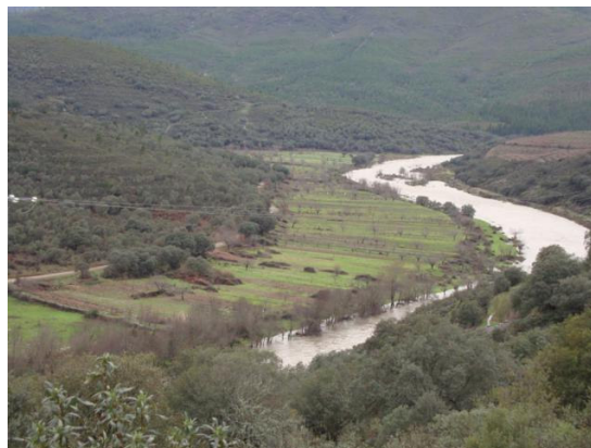
Paraje de las Suertes

El diccionario define el término soto como un lugar poblado de árboles, en la vega de los ríos y generalmente con buen clima. Descripción perfectamente válida y acertada para Sotoserrano.