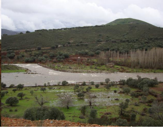
Unión del río Alagón con el Cuerpo de Hombre

Los puntos más altos del término, se localizan al sur del mismo, en las inmediaciones del alto de La Calama, con 1032 m. , y los más bajos, en el extremo suroccidental, en el límite con la provincia de Cáceres, donde el río Alagón discurre a través de terrenos cuyas cotas están sobre los 400 m. de altitud.