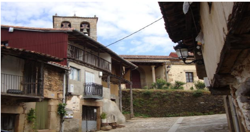
Barrio de la Iglesia