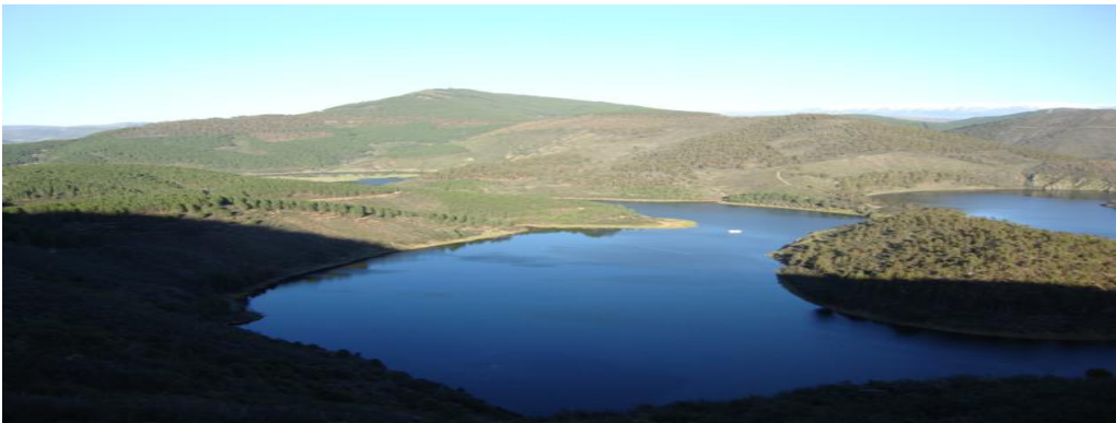
Encajonamiento del Alagón (Meandro de Melero) dentro del límite territorial de Sotoserrano

Sotoserrano limita al norte con Cepeda al Sur con Valdelageve, al este con Miranda del Castañar y Pinedas y al oeste con Herguijuela de la Sierra.