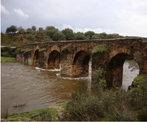
Puente romano sobre el Alagón