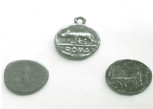
Monedas y Medalla con la efigie de Agripa