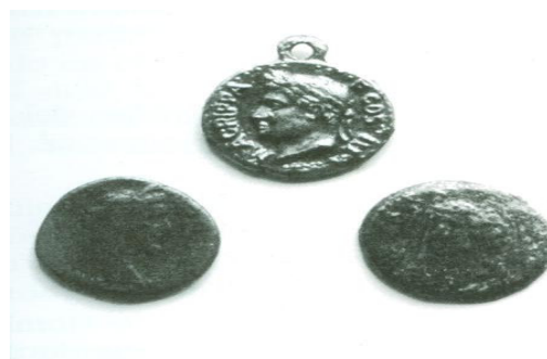
Monedas y medalla con la efigie de Agripa del Paraje de la Viña

Debido a la buena comunicación que tiene Sotoserrano con el resto de pueblos de alrededor, en la antigüedad fue un pueblo de paso y debido a esto, podemos encontrar en él estos ocho yacimientos de época romana :