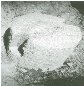
Pisón hallado en el Castañar de los Jurados. Periodo tardorromano

A este periodo pertenece también la pequeña necrópolis hallada en el lugar de la Ermita , donde, en 1985, aparecieron varias sepulturas con cubierta de pizarra, conteniendo algunos fragmentos óseos y tégulas. Otros yacimientos de dicha época se han localizado en las Viñas del Castillo, La Maya, Pedro Martín, Peláez, Peña Lobera, El Gamonital, Las Canteras y Los Castañares.