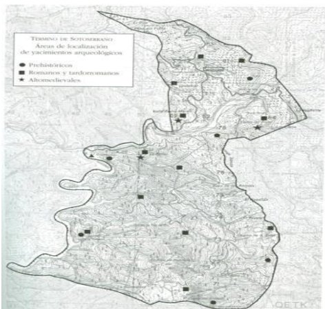
Localización de los yacimientos arqueológicos en el término de Sotoserrano.