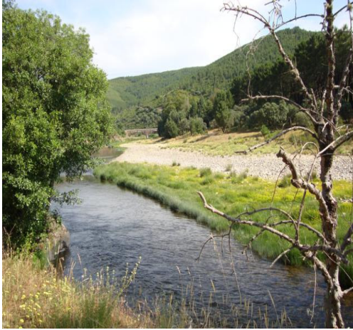
Zona de la Ferrería, donde se trabajaba el mineral de hierro.