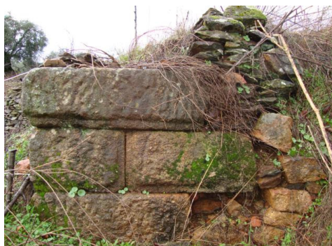
Restos romanos en el Paraje de la Viña