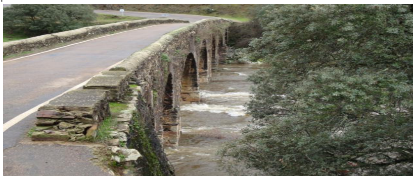
Puente de siete ojos sobre el río Alagón (pasaba la Antigua Calzada que arrancaba de la Vía de la Plata)

Otros vestigios de la presencia romana en tierras de Sotoserrano vienen determinados por el trazado de una ANTIGUA CALZADA que, arrancando de la Vía de la Plata, a la altura de Aldeanueva del Camino, discurría, por Abadía, todavía dentro de Extremadura, penetrando, después, en la provincia de Salamanca, por Lagunilla y Valdelageve, antes de llegar a terrenos de Sotoserrano, donde se conserva un puente de siete ojos.