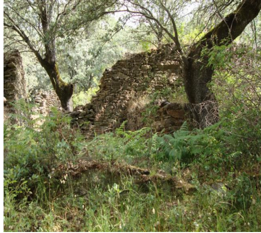
Restos de la antigua explotación donde se trabajaba el hierro