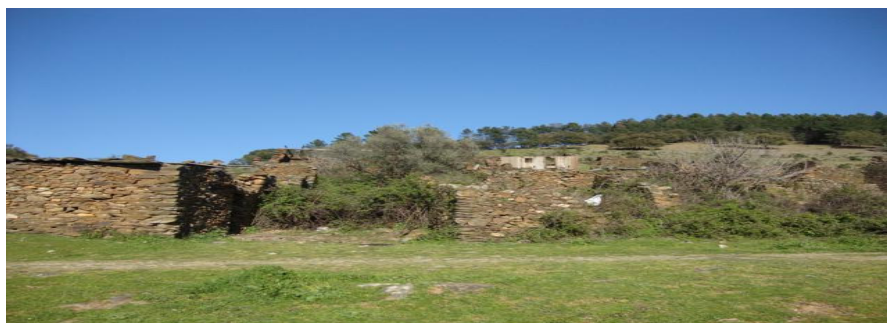
Antigua alquería de Cabaloria perteneciente a Sotoserran

La región donde se encuentra Sotoserrano , en la frontera con la actual Extremadura, venía a marcar, hasta el siglo XII , el límite septentrional de la zona de dominio musulmán . Por aquel entonces, la mayoría de los núcleos de población de la Sierra de Francia, poseían categoría de aldea; pero eran los situados en el Bajo Alagón, los que presentaban más escasa densidad demográfica: Santa María de los Llanos, Molinillo, Pinedas y Sotoserrano, con sus anejos Cabaloria y Martinebrón