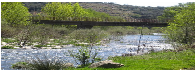
Río Francia a su llegada al río Alagón (en sus proximidades estuvo situada una antigua fortificación altomedieval)

Por lo que respecta a las fortificaciones altomedievales localizadas en el término de Sotoserrano, una de ellas se encontraba a las afueras del casco del pueblo. Las otras dos se hallaban ubicadas en las inmediaciones de Cabaloria y en la confluencia de los ríos Francia y Alagón .