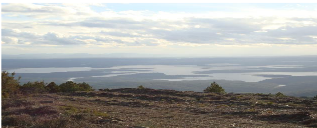
Terrenos de Sotoserrano, limítrofes con el término de Granadilla(al fondo Pantano de Gabriel y Galán)

Junto con La Alberca, Sotoserrano formaba parte de la Tierra de Granadilla , integrada por diecisiete pueblos, más ocho concejos enclavados en la Alta Extremadura . Todos ellos pertenecientes al Obispado de Coria .