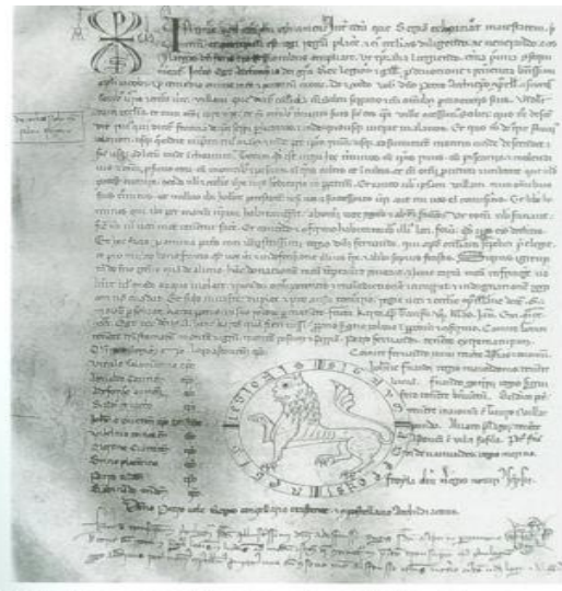
Mediante este documento, fechado en Toro, en el año 1192, Alfonso IX confirma y amplía los privilegios y posesiones otorgados, sobre Herguijuela y Sotoserrano, al arzobispo de Santiago de Compostela.

Donación real que será confirmada y ampliada cuatro años más tarde a la totalidad de los términos de dichas localidades, a las que otorga fueros . Esta donación fue en el año 1192 cuando Alfonso IX concede en perpetuidad al referido arzobispo los molinos, los ríos, las pesqueras, los montes, las tierras todas, con todos los productos útiles que en ellas se recogieren. El texto de este nuevo documento es muy explícito y en él ya no aparece escrito el nombre de Saltu de Francia , sino Saltu Serrano . Dicho texto dice: < Vestre villam que dicitur Ecclesiola cum Saltu Serrano... Totum quod est intra los términos, cum ipsis rivis, cum piscariis et molendinis et omni proficuis eorum, cum montibus et pascuis, cum terris cultis et incultis, et cum omni proventu et utilitate... >