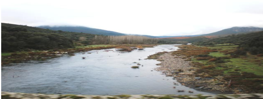
Ribera del Alagón (en el siglo XIII el margen izquierdo del río pasó a pertenecer a Sotoserrano)

A raíz de dicha delimitación territorial que fue llevada a cabo por el infante don Pedro en el año 1288 , toda la ribera izquierda del río Alagón, hasta el límite con el término de Granadilla, pasó a pertenecer a Sotoserrano.